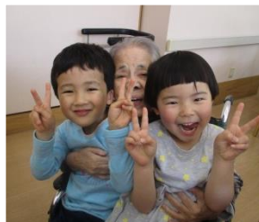
地域との繋がりを大切にしています

様々な行事を近隣のウブントウ幼稚園と合同で実施しています。子供たちの元気な姿に、自然と笑みがこぼれます。