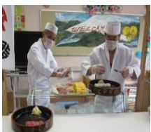
♪お寿司バイキング

栄養は勿論、季節や食材を感じる食事を栄養士が献立。刻み食・ミキサー食など様々な食事形態に対応しております。